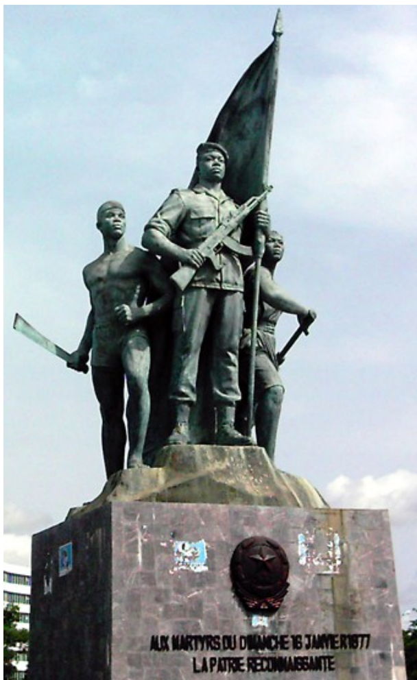
Place des Martyrs à Cotonou : monument érigé en hommage aux victimes d'une tentative de putsch en 1977 durant la période marxiste-léniniste

Les échanges de biens (rôle joué notamment par le port de Cotonou) ainsi que la production de coton constituent la base principale de l'économie du pays, confronté à l'endettement et à la pauvreté (PNB par habitant en 2005 : 196 e position sur 230 pays). La filière coton représente 75% des exportations mais est confrontée à la concurrence d'autres pays, concurrence dont le caractère déloyal est souvent dénoncé. L'agriculture emploie 55% de la popula-