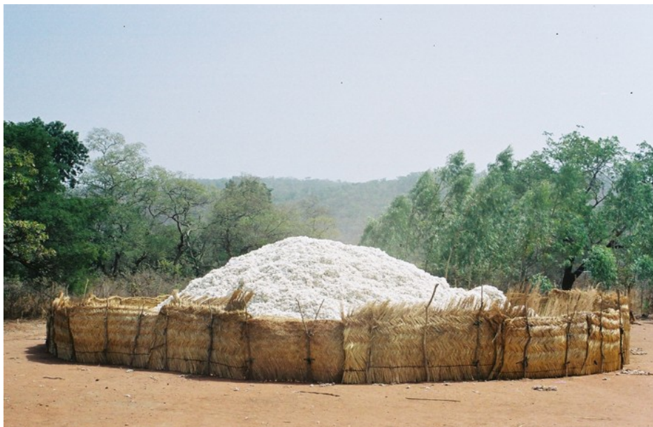
La filière coton représente 75% des exportations du Bénin mais est confrontée à la concurrence d'autres pays, concurrence souvent déloyale Lire à ce sujet : «Voyage au pays du coton. Petit précis de mondialisation.» Par Erik Orsenna (Fayard, Paris, 2006)

tion active. La Chine est actuellement le principal client du Bénin (et le deuxième fournisseur). Depuis quelques années on assiste à une libéralisation de l'économie, la période marxiste-léniniste ayant été marquée par de multiples nationalisations. Une grande partie de l'économie reste informelle. La part du produit intérieur brut consacrée aux dépenses de santé est en augmentation sur les dernières années et se situe à 4,9 % en 2004. Contrairement à certains de ses voisins, le budget de l'éducation et le budget de la santé du Bénin sont plus élevés que celui de la défense.