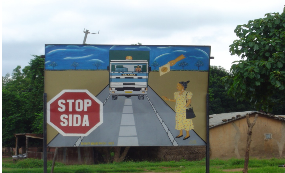
Sur la route reliant Cotonou (Bénin) à Niamey (Niger), les routiers et les prostituées sont mis en garde contre le SIDA : STOP SIDA avec le préservatif

L'espérance de vie à la naissance est de 52 ans pour les hommes et de 53 ans pour les femmes en 2005. Cette espérance de vie est supérieure de cinq ans à celle du Nigéria voisin mais reste inférieure à celle d'autres pays d'Afrique francophone. Le taux de mortalité infantile est de 89 pour 1000 naissances d'enfants vivants en 2005. Le nombre de personnes porteuses du virus VIH, présentant ou non des symptômes de SIDA, est estimé entre 57 000 et 120 000. Ce taux, qui comporte d'importantes disparités régionales, aurait diminué durant les dernières années mais cette évolution traduirait davantage une amélioration du recueil des données que de véritables changements de comportement. La prévalence particulièrement élevée chez les travailleuses du sexe a conduit à la mise en œuvre de projets spécifiques. .../... suite au numéro 27